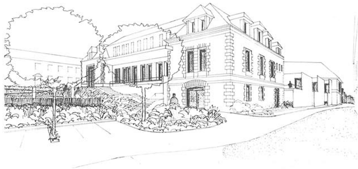
Vues extérieures: la promenade