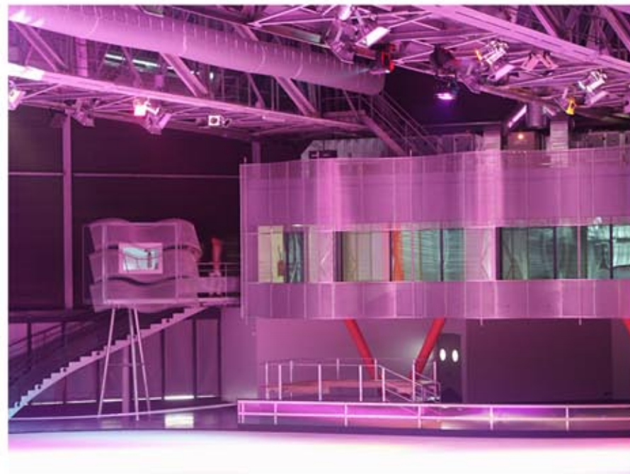
Espace bar et régie