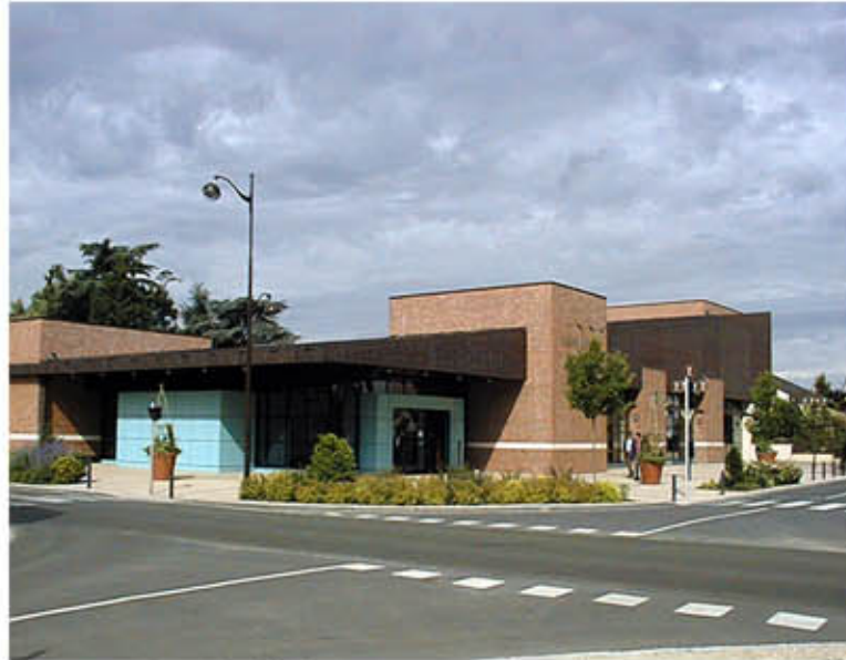
Perspective du bâtiment