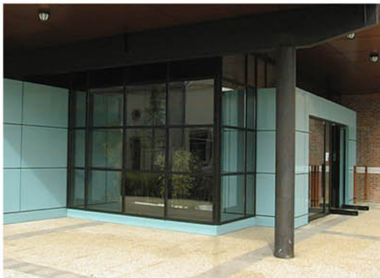
Entrée du bâtiment