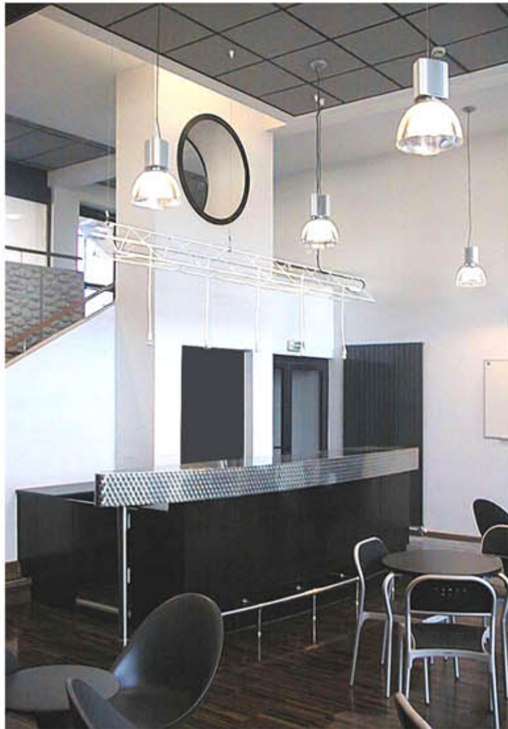
Le foyer des élèves